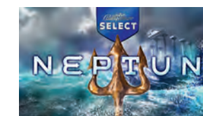
SELECT NEPTUN* *exklusiv im SELECT 3 IN 1 enthalten